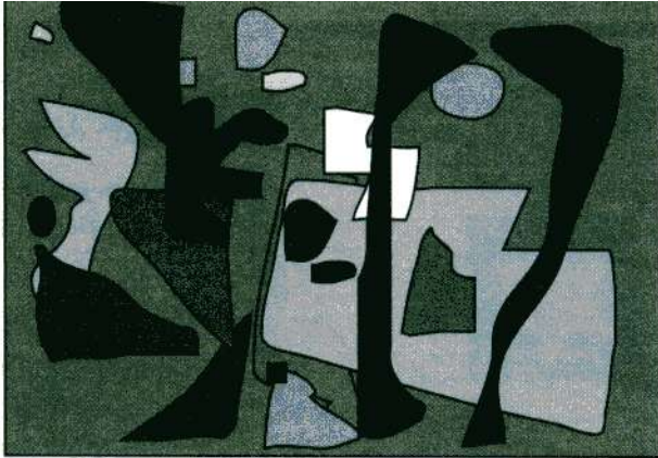
Diversos tonos de gris en una composición.

Los diversos matices de color tienen un tono de mayor o menor grado de claridad, aunque a veces no sea fácil apreciarlo. En la ilustración podemos darnos cuenta de la equivalencia aproximada de los tonos de cinco colores en relación a una escala tonal del blanco al negro.