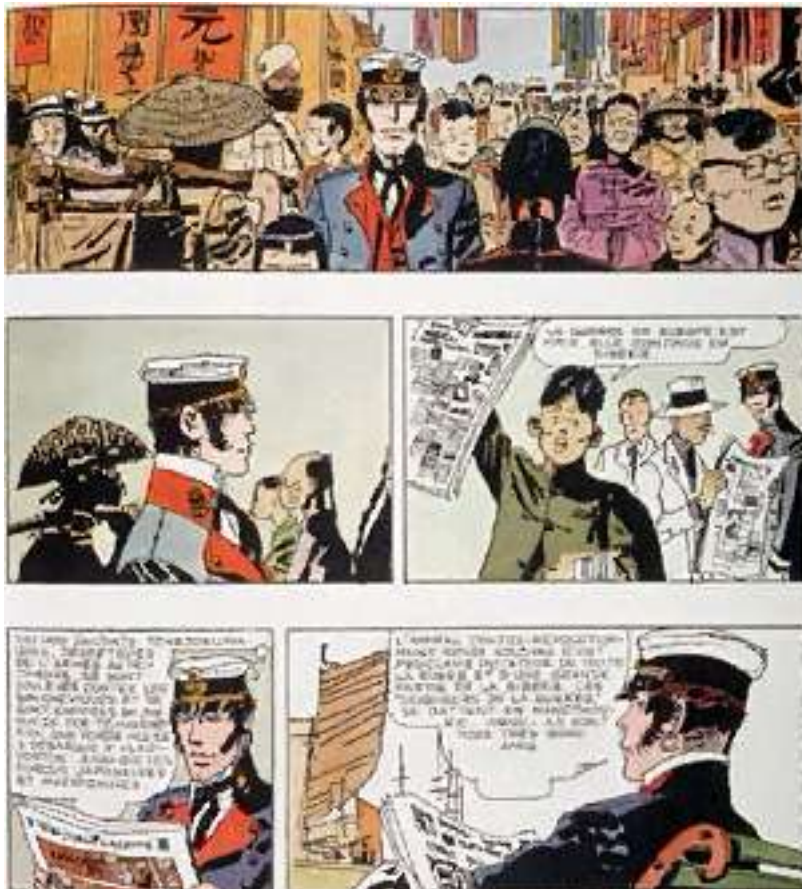
Corto Maltés en Siberia de Hugo Prats