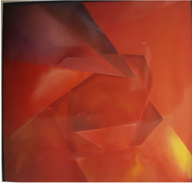
rosa cubista del autor

experiemento gráfico en azul blanco con latex a-4